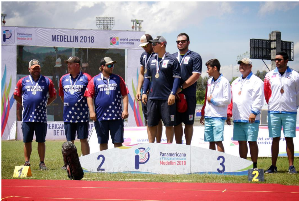
Compound Men Team 1. COL, 2. USA, 3. PUR