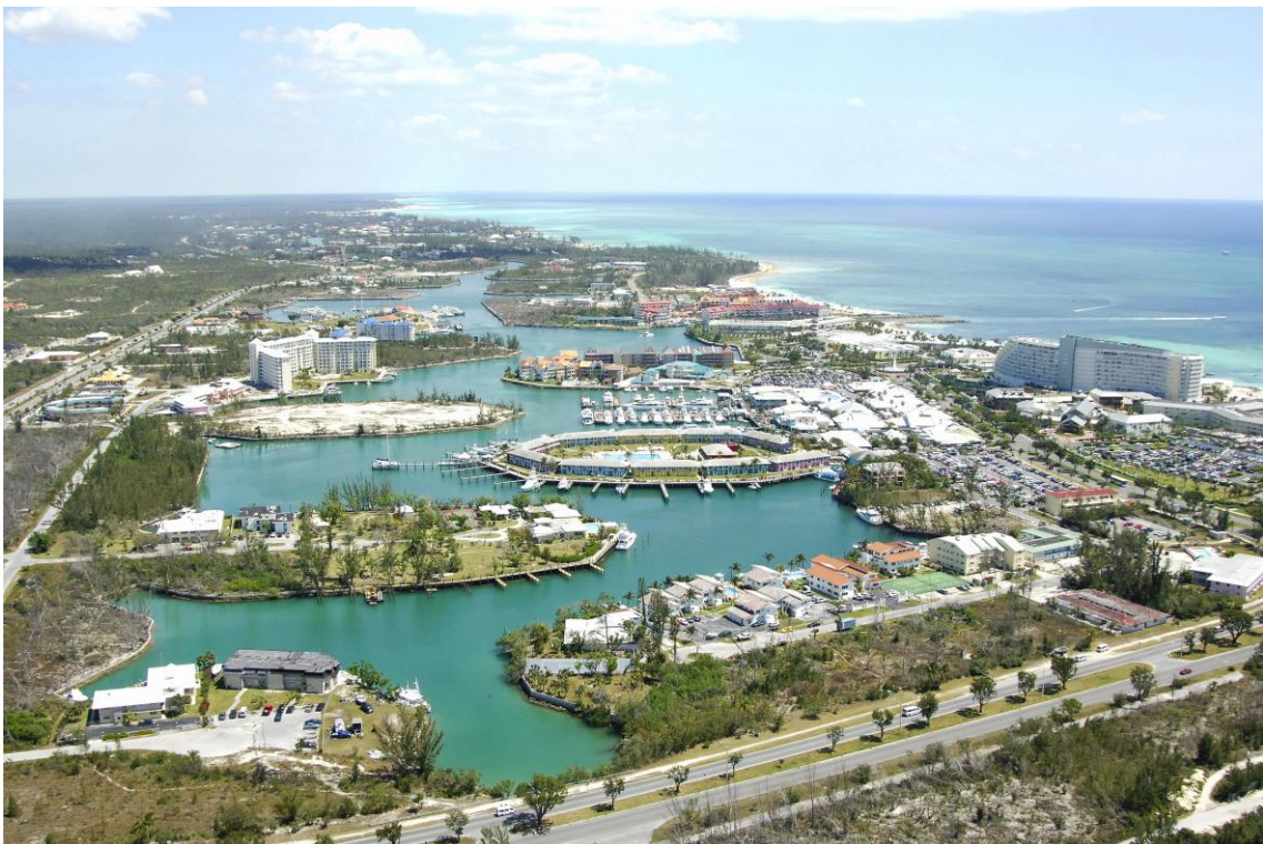
Freeport, Bahamas, acogerá el tercer Campeonato de Desarrollo del Caribe en 2019

La Ciudad de México será la sede del Campeonato Panamericano y Parapan Americano en el año 2020, mientras que Bahamas organizará el tercer Campeonato de Desarrollo del Caribe en abril del año 2019.