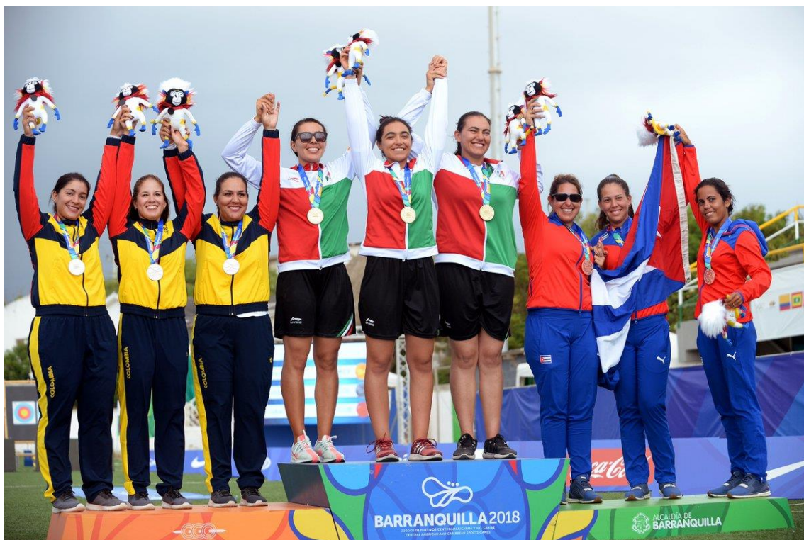
Equipo Recurvo Femenino: México, Colombia, Cuba