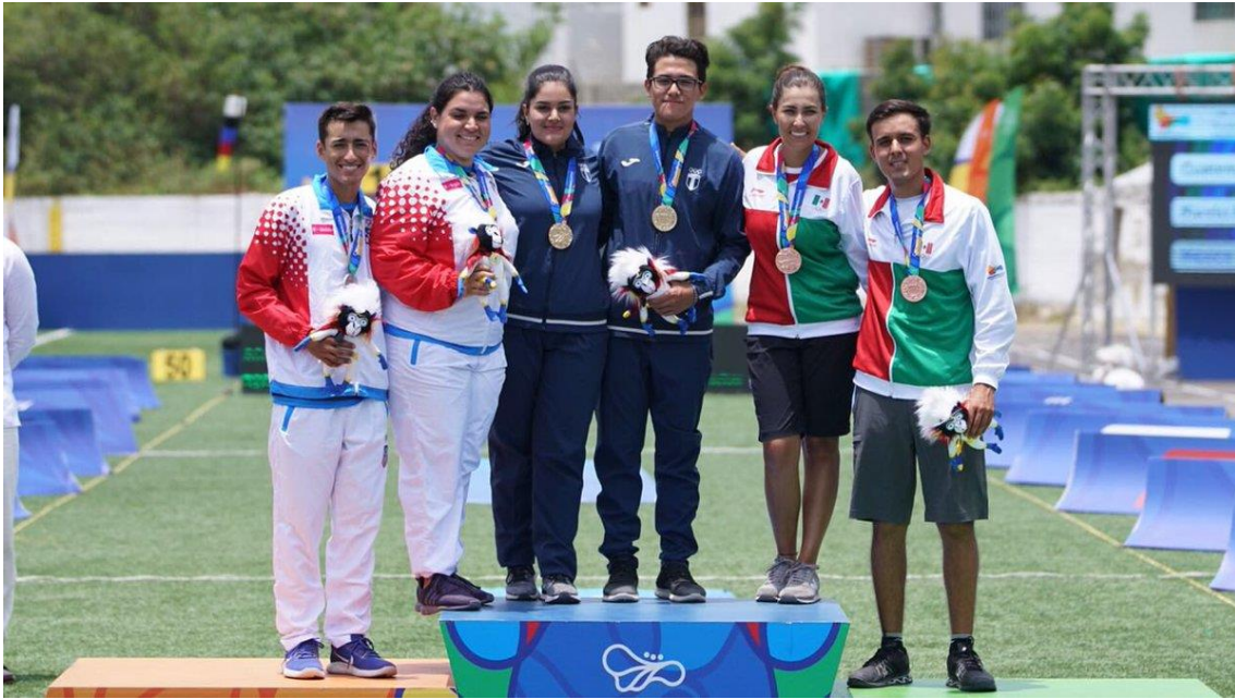
Compound Mixed Teams: 1. Guatemala, 2. Puerto Rico, 3. México