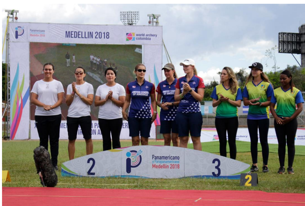
USA, Mexico and Brazil qualified full recurve women teams for Lima 2019