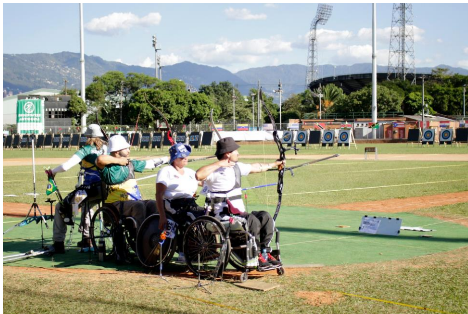
Brazil vs Mexico Recurve Open Mixed Teams