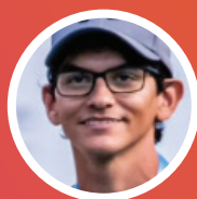
D. JAJARABILLA CENTRO DE ARQUERÍA MAR DEL PLATA